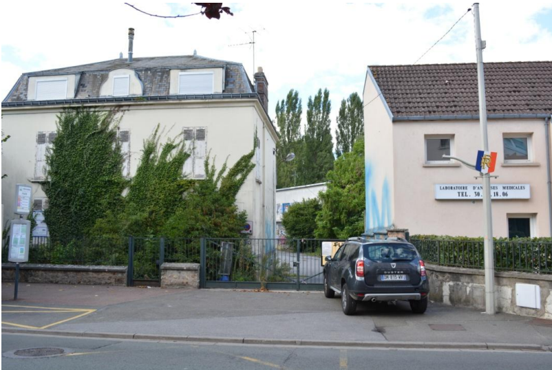
Entrée terrains EDF rue de la République