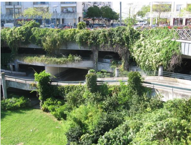
Exemple de parking semi enterré pour la gare